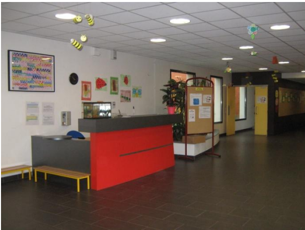
Le hall d'entrée