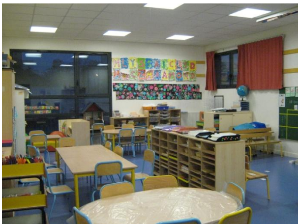
Une salle de classe