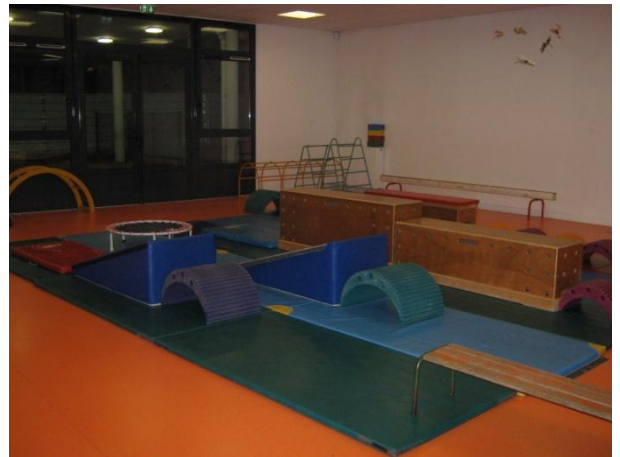
La salle de sport